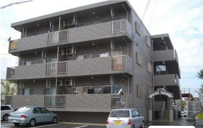
写真は東側です。(1号室・2号室側)