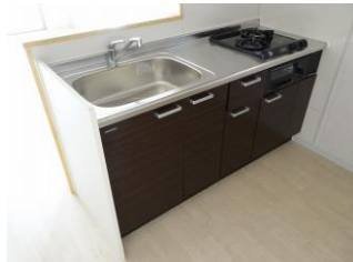
ビルトインコンロキッチン