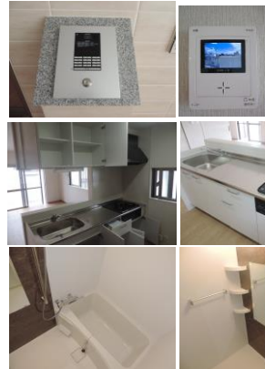
※写真は全てイメージ写真です。 現状と異なる場合は原状を優先とさせていただきます。