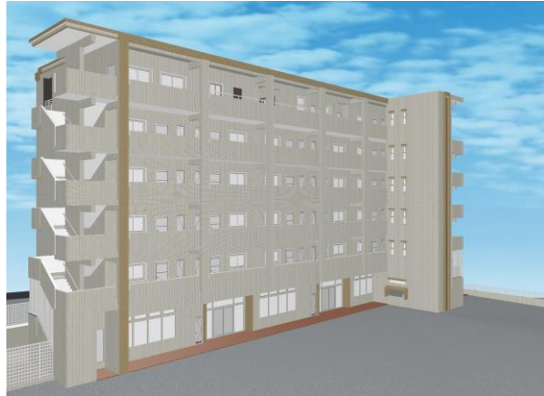
※外観イメージパース 実際のものとは異なる場合は現況優先となります。